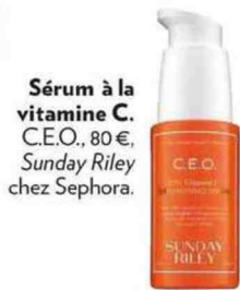
Sérum à la vitamine C. C.E.O., 80€, Sunday Riley chez Sephora.