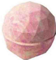
Boule de bain. Diamond Dust, 9,95€, Lush.