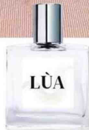
Eau de parfum. Lùà, 50 ml, 59€, EnjoyPhoenix x Le Parfum Citoyen.

“Je me maquille de manière beaucoup plus simple, je suis moins dans l'apparat”