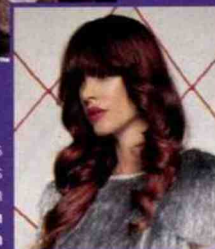
URBAN KERATIN/PASCAL LATE