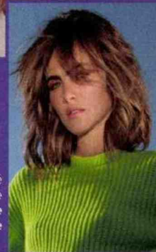
Le dégradé aérien de Camille Albane