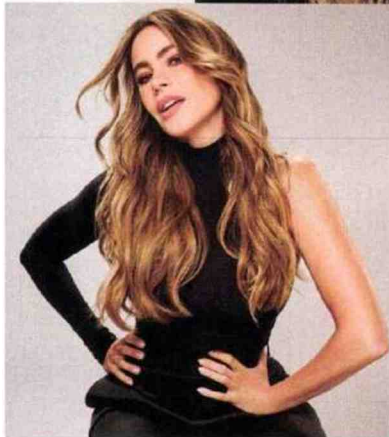
Sydney Sweeney (ci-dessus) pour Kérastase, et Sofia Vergara pour Schwarzkopf.